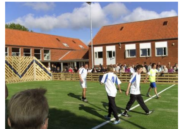
Multibanen ved Idrætsefterskole Ulbølle

Derudover ønsker LAG Svendborg at bidrage til kompetenceudvikling af personer involveret i udviklingen af attraktive levevilkår og i skabelsen af flere arbejdspladser i landdistrikterne.